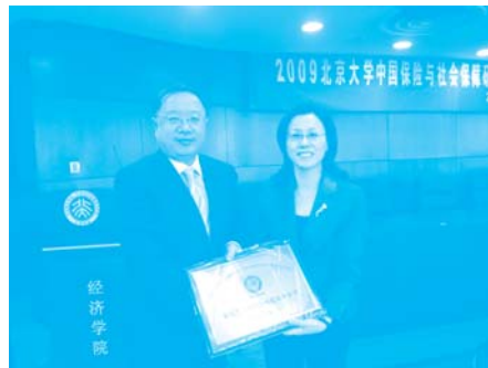
孙祁祥教授为新理事会员单位的代表颁发牌匾

在年会上,中心秘书长郑伟博士向与会代表作了 2008-2009 年度中心工作报告。郑伟博士介绍了过去一年中心举办的各类活动以及取得的荣誉,并对未来活动进行了展望。据介绍,过去一年间,中心成功举办了“2008 中心理事会员年会”、“中心五周年暨保险系十五周年庆”、第六届“北大赛瑟 (CCISSR) 论坛”、九次“CCISSR 双周讨论会”、四次“北大英杰华 (Aviva) 保险系列讲座”、“保险制度与市场经济”圆桌论坛暨新书发布会、亚太风险与保险学会第 13 届年会、出版三期“中心简报”、承担英杰华集团课题“保险制度与市场经济”、出版《中国保险市场热点问题评析》、《保险制度与市场经济》、《金融危机:监管与发展》(电子书)等多部著作,在理论研究、学术交流、人才培养等方面做了大量的基础工作,在国内外学术界和业界产生了积极的影响,赢得了普遍的赞誉。2009 年,中心从北大 240 多个科研中心中脱颖而出,再次被评为“北京大学第二届人文社会科学优秀科研机构”,成为北大为数不多的蝉联两届的优秀科研机构。